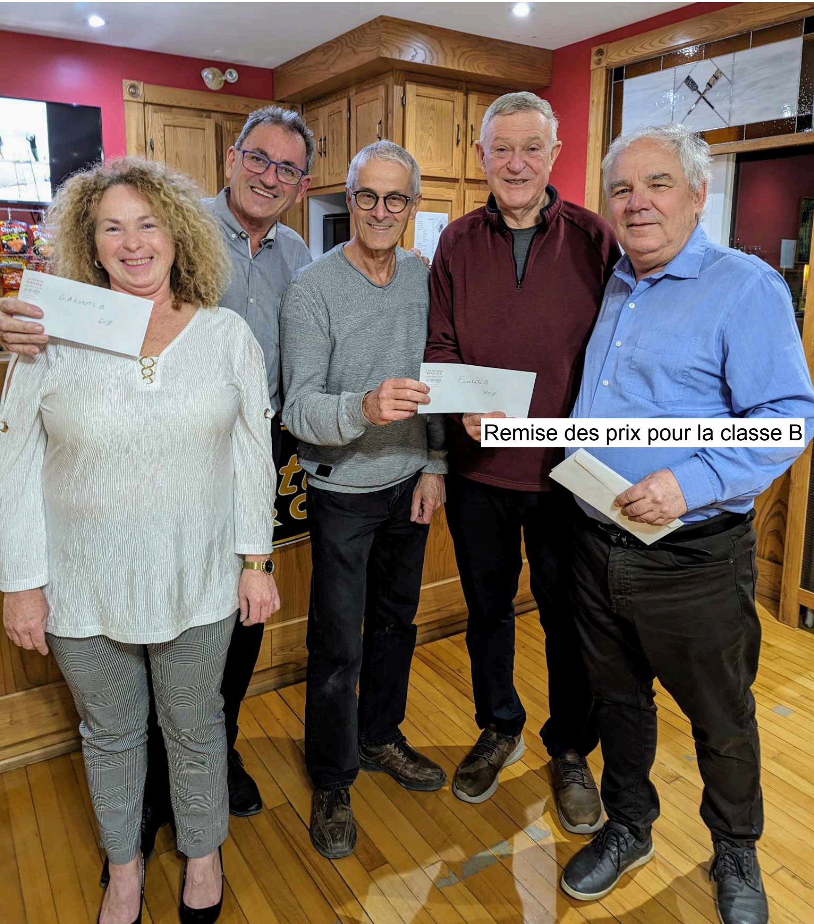
Remise des prix pour la classe B