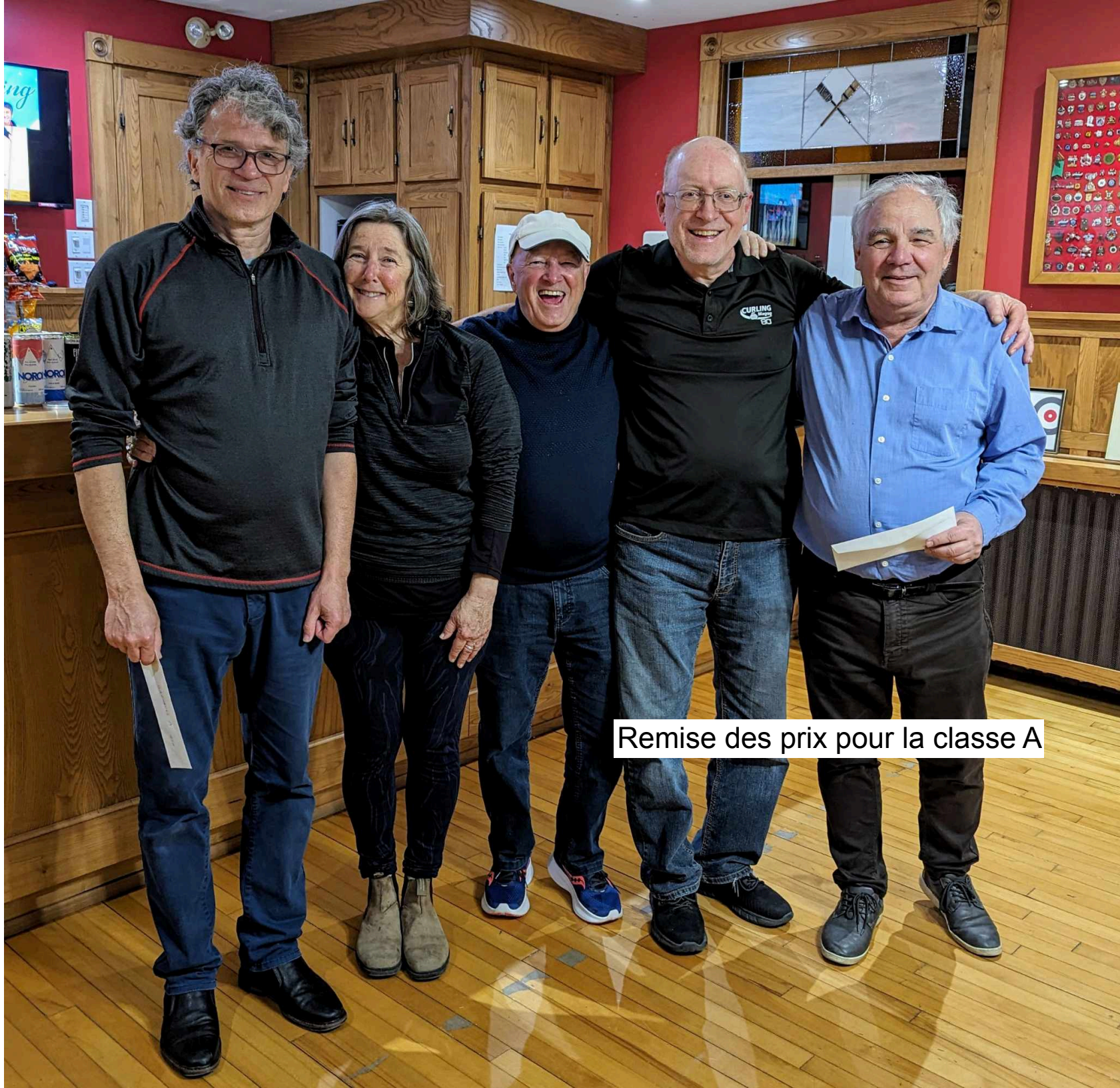
Remise des prix pour la classe A