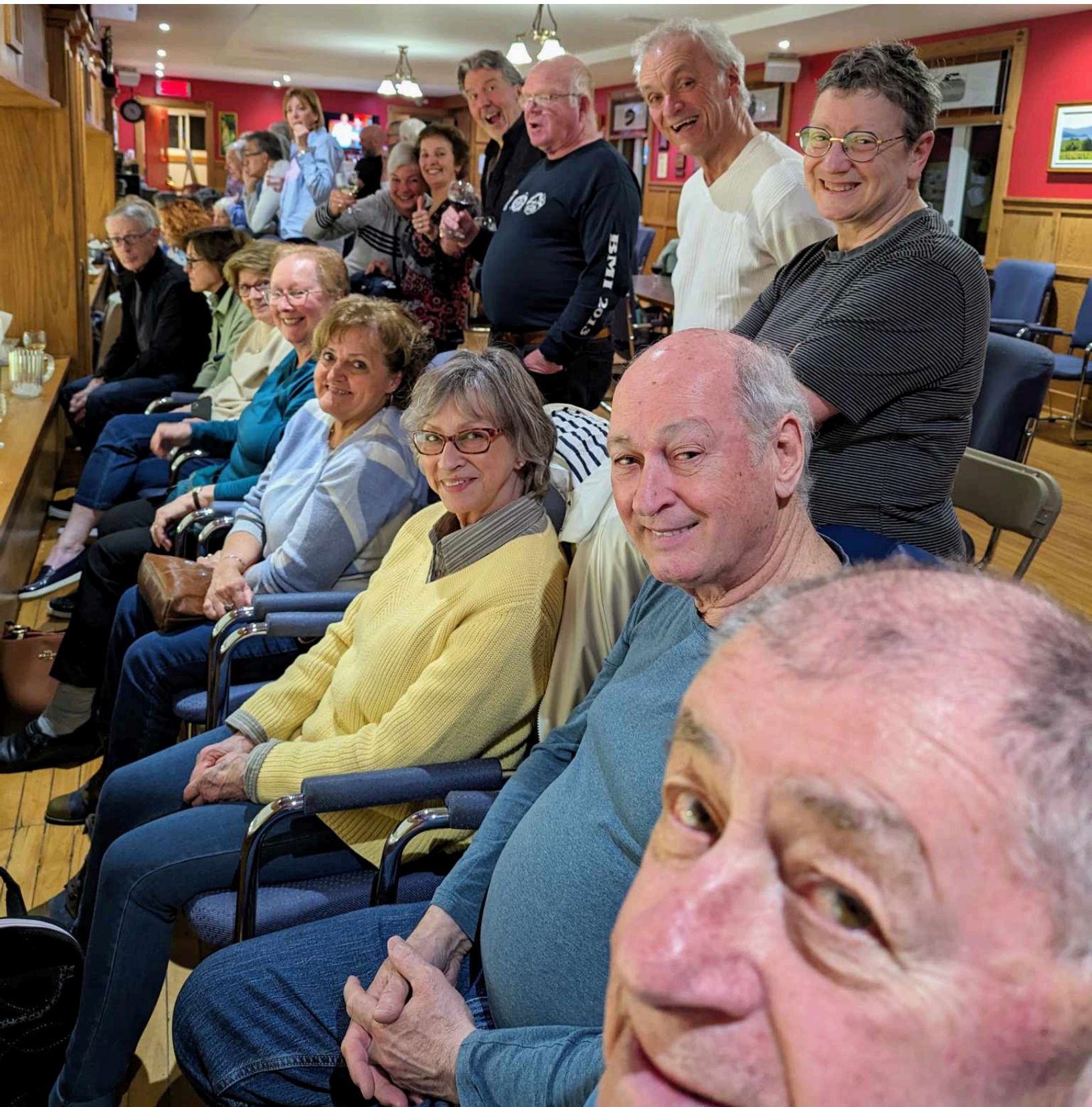
Les Skips de vitrine