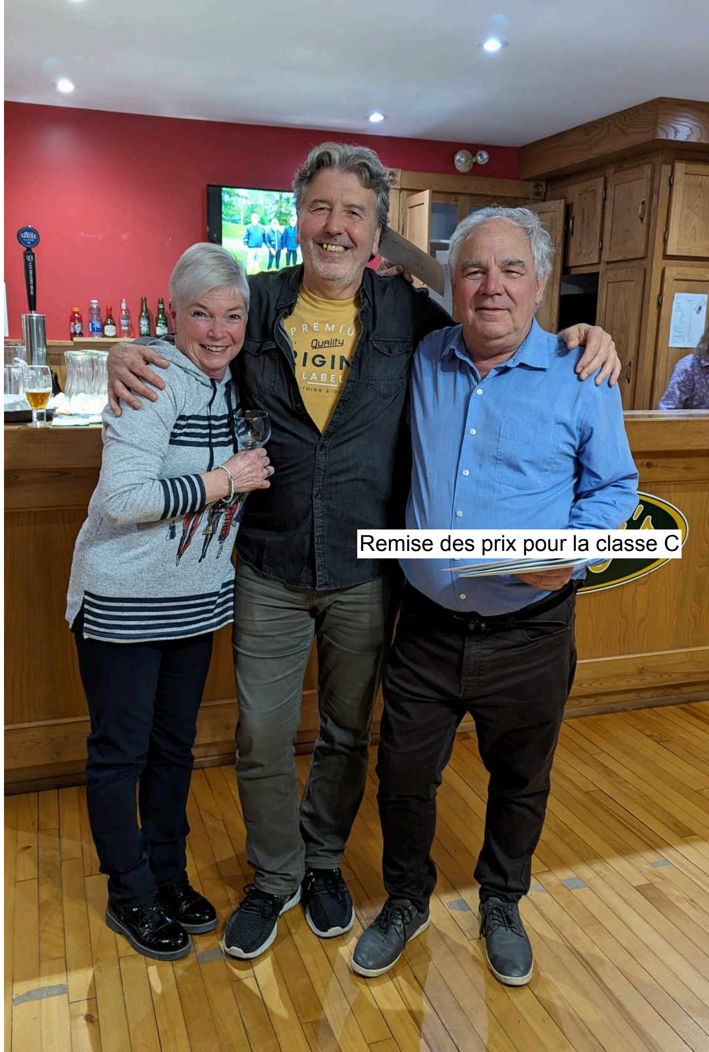
Remise des prix pour la classe C